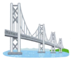
16. 本州と四国を結ぶ 瀬戸大橋