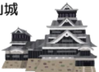
6. 川面に映える漆黒の城 岡山城